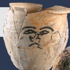
人面墨画土器 / 山王遺跡