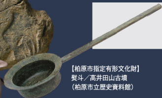
【柏原市指定有形文化財】 熨斗 / 高井田山古墳 (柏原市立歴史資料館)