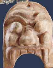
【重要文化財】 鬼瓦 / 特別史跡多賀城跡附寺跡 (東北歴史博物館)