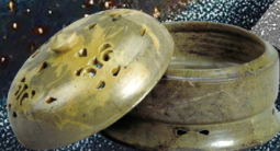
緑釉陶器香炉 / 平安京 西市跡 (京都市考古資料館)