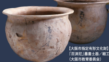
【大阪市指定有形文化財】 「百濟尼」墨書土器 / 細工谷遺跡 (大阪府教育委員会)