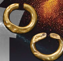
金環 / 四天王寺 (四天王寺)